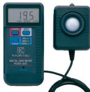
MEDIDOR DE INTENSIDAD LUMINOSA MOD 5202 RANGOS 200/2000/20000 LUXS