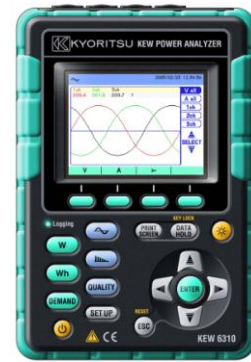
ANALIZADOR DE CALIDAD DE ENERGIA MODELO 6310 MIDE VOLTAJE, CORRIENTE, POTENCIA ACTIVA, REACTIVA Y APARENTE, ENERGIA ACTIVA, APARENTE, REACTIVA, FRECUENCIA., ARMONICOS, DESBALANCEO, TRANSITORIOS, CAIDAS, SUBIDAS E INTERRUPCIONES DE VOLTAJE COMUNICACIÓN A PC CAT III 600 V