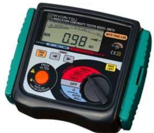
MODELO 3007 A

500V/1000V/2500V/5000V- MEDICION DE RESISTENCIA HASTA 1TΩ Índice de polarización Función autodescarga Medición de Volts CA/CD Contador de tiempo