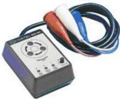
INDICADOR DE FASES MOD. 8031 110 -600 VCA CAT III 600 V