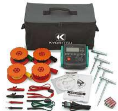
MEDIDOR DE TIERRAS FISICAS Y RESISTIVIDAD MODELO 4106

Modelo 4105 A Digital Medicion 20/200/2000 Ω Modelo 4102 A Analógico Medicion 12/120/1200 Ω