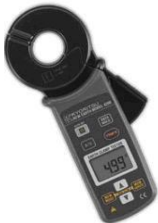
TIPO GANCHO MODELO 4200

Medicion de Resistencia 20/200/1200Ω Medicion de Corriente 30 A Registro de hasta 100 mediciones