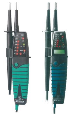
PROBADORES DE VOLTAJE AC/DC 690V, CONTINUIDAD E INDICACION DE ROTACION DE FASES, PROBADOR DE POLARIDAD MODELO 1710 CON DYSPLAY MODELO 1700 SIN DYSPLAY